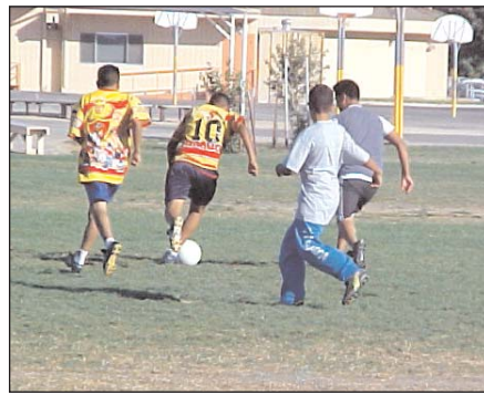
La juventud de King City juega al fútbol detrás de la escuela Santa Lucía.

Para reducir la carga de los limitados parques y darles una oportunidad a los jovencitos para tener el campo de sus sueños, Arboleda de CreekBridge, un vecindario planificado con 400